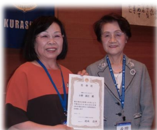
地区委員任命状伝達

どうぞ、皆様のご指導、ご協力をお願い申し上げますとともに地区委員就任のご挨拶とさせていただきます。