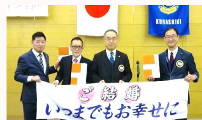
2月これからもお幸せに